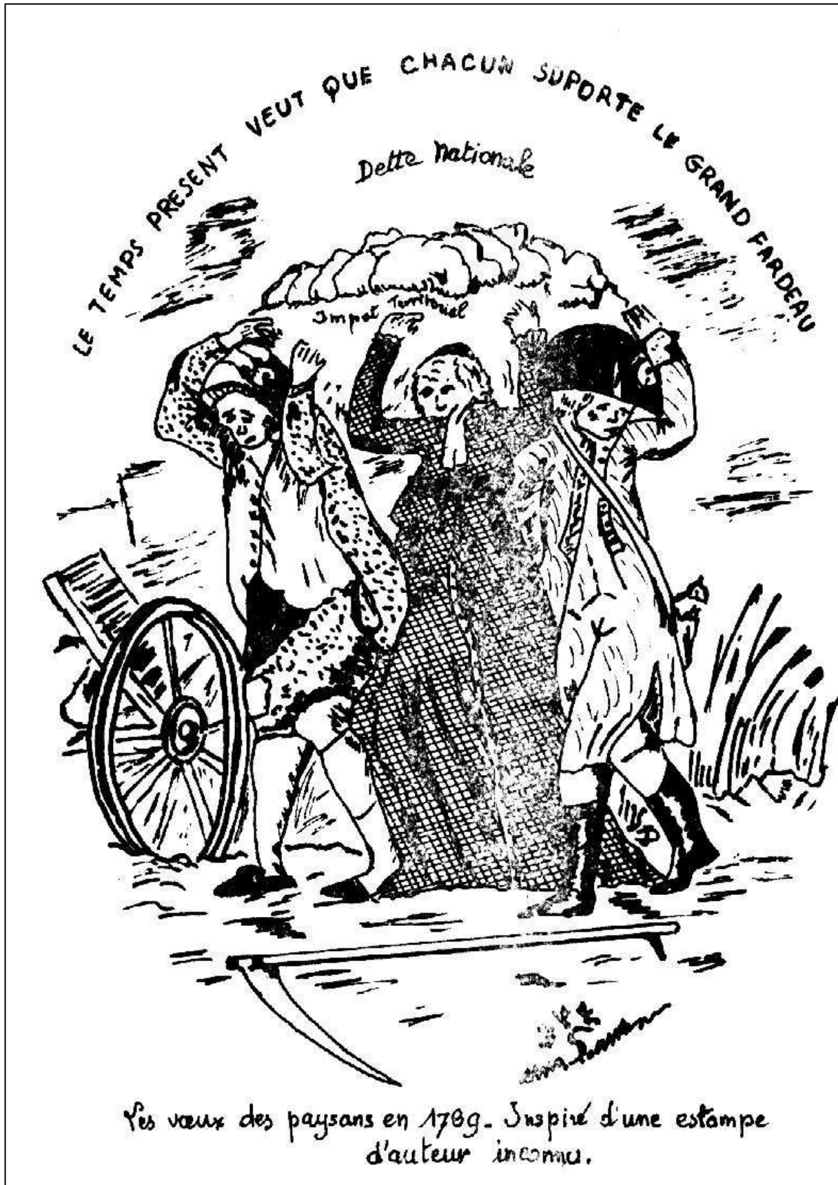
Les vœux des paysans en 1789. Inspiré d'une estampe d'auteur inconnu.